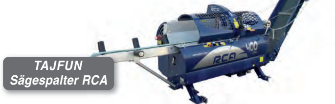
TAJFUN Sägespalter RCA