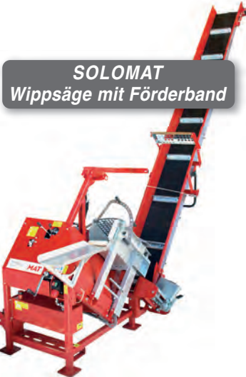
SOLOMAT Wippsäge mit Förderband