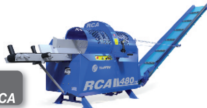
TAJFUN Sägespalter RCA